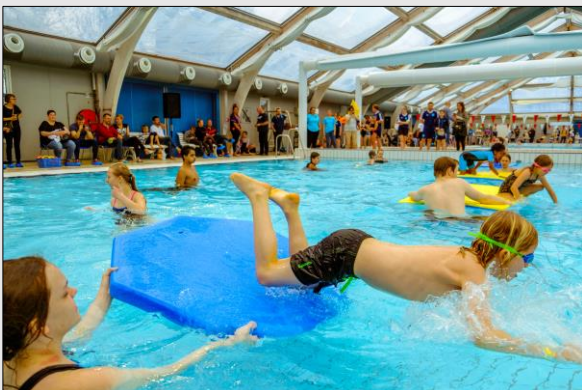
Forhindringsbanen fra Svømmeskolestævnet.

I løbet af en sæson i Hovedstadens Svømmeklub inviterer vi vores svømmere til en lang række events og aktiviteter i Svømmeskolen. Et eksempel herpå er vores netop overståede Svømmeskolestævne. Stævnet forløb over en hel weekend i marts og samlede næsten 700 forventningsfulde svømmere, omkring 100 trænere og hjælpetrænere, en masse frivillige og naturligvis en hel hær af stolte forældre og bedsteforældre på kanten.